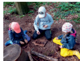
Tiere hautnah erleben