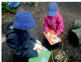
Neue Freunde finden

Während unserer Sommerwaldfreizeit wollen wir den Wald und die darin lebenden Tiere und Pflanzen erforschen. Wir werden Waldhütten bauen und tolle Spiele spielen. Na, Lust bekommen? Dann kommt vorbei und macht mit!